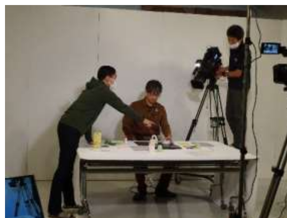
プロから丁寧な撮影指導