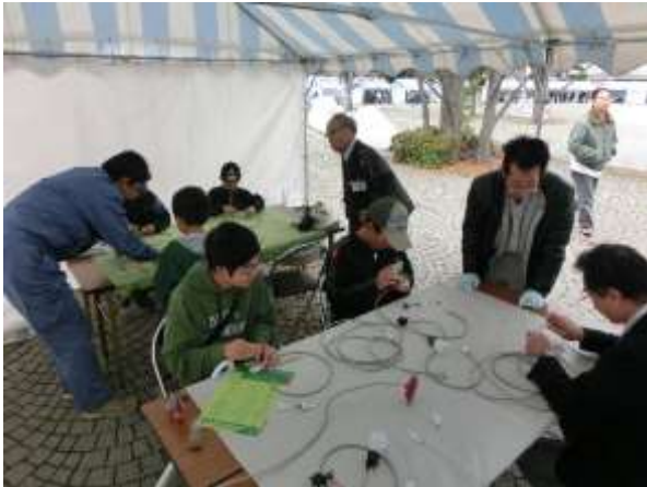
子供に交じり大人の参加も多かったです