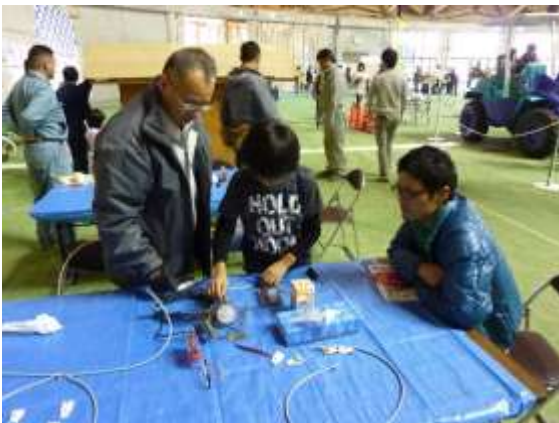
延長コード作成、電気つくかなあ？