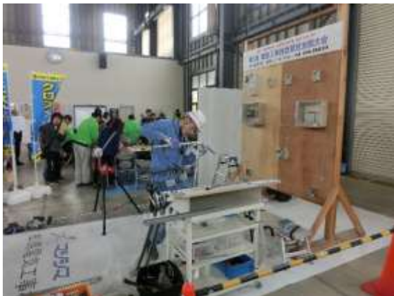
ミリ単位のパイプ曲げもお見事の一言!!