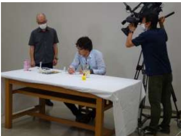
昨年と同じスタッフさんで撮影もスムーズ