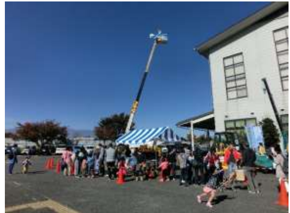
首の長いキリンを目指して行列ができました