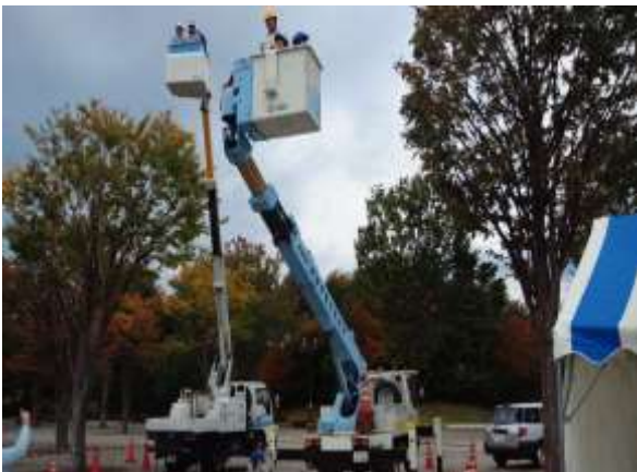
今年は天候が悪く眺めもイマイチでした