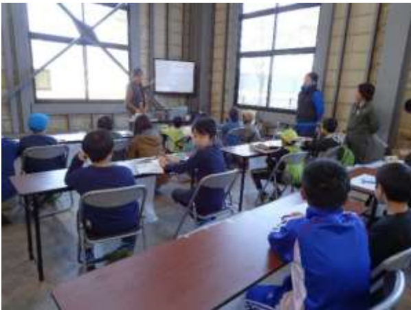
電気工事の仕事紹介、待ちきれない様子