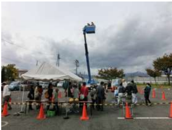
乗車体験に長い行列が絶えませんでした