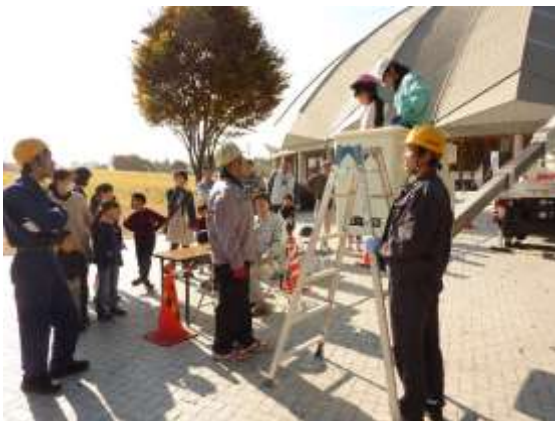
人気の高所作業車、子供たちも笑顔(^O^)