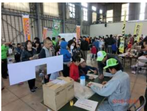
受付は希望者が殺到し行列に