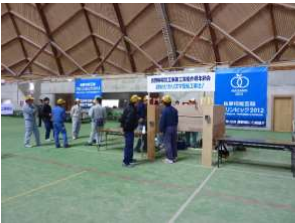
アビリンピック長野2012 プレイイベントとして