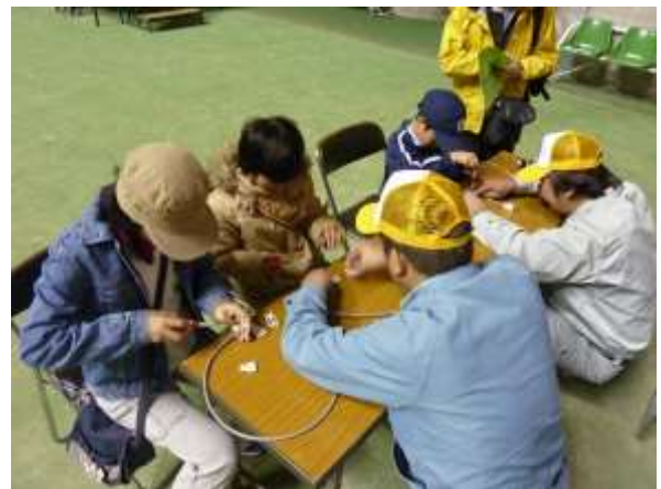
延長コード作成の真剣な眼差し