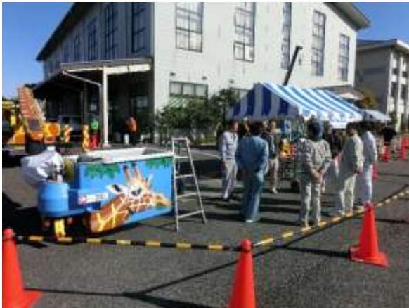
今年は可愛いキリンの高所作業車です