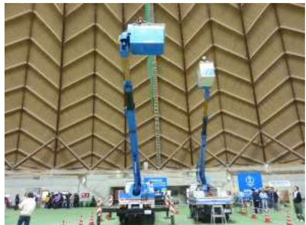
高所作業車2台による乗車体験は行列でした