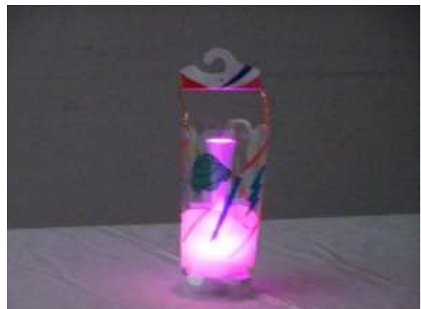
昨年のランプからマイナーチェンジ