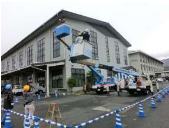
親子で別々に乗車し離れて記念撮影パシャ☆