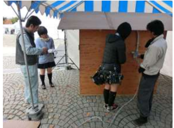
配線体験に2人の女子高生が飛入り参加