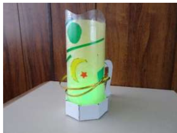
2時間かけて完成！撮影終了