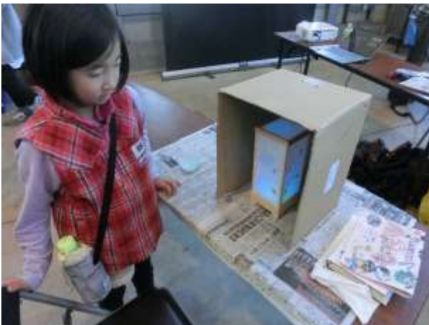
ランプがついて可愛く完成しました(^_-)-☆