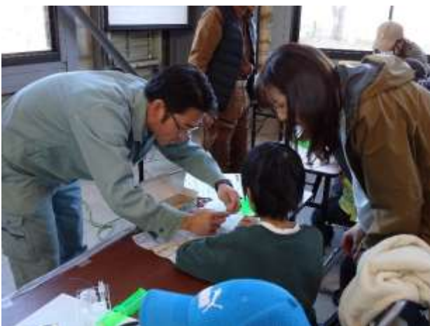
難しいところは会員が丁寧にサポート