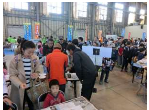
20組分のランプは、あっという間に終了