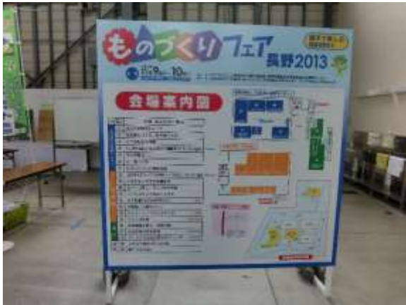
20の団体ブースが盛大に出展しました