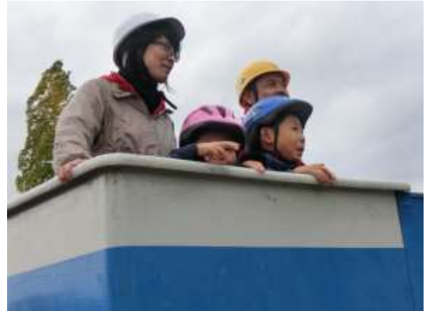
親子3人で仲良く乗車、高くて怖いよお