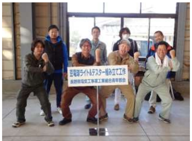
大成功の記念撮影は流行のハカのポーズ