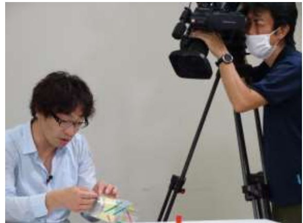
子供たちに分かりやすく丁寧に