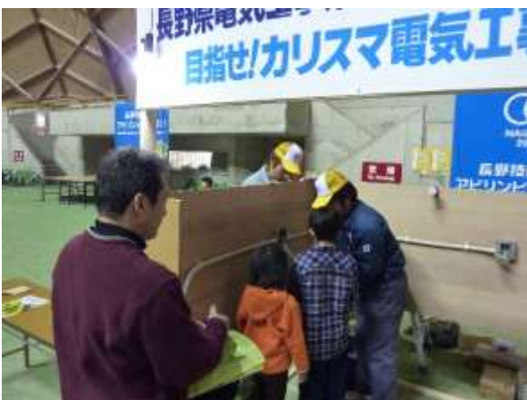
目指せ！カリスマ電気工事士！！体験