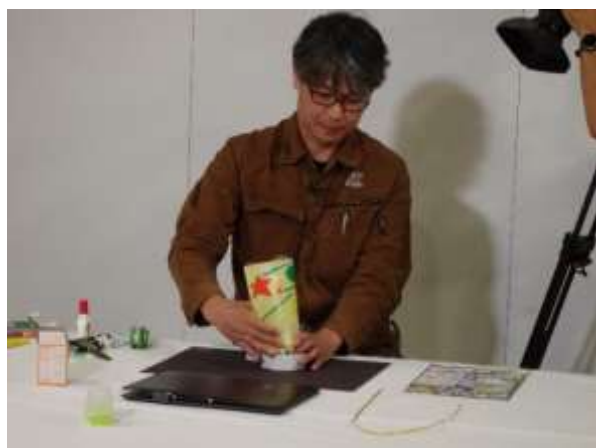
1つ1つのコマを少しずつ撮影