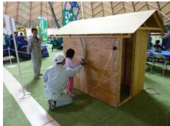
住宅模型の配線に小さな女の子が挑戦☆