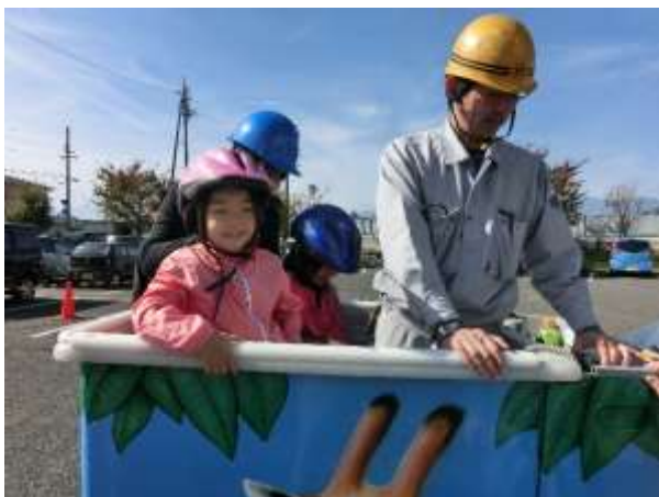
キリンの乗り物に上がる前からテンションも↑