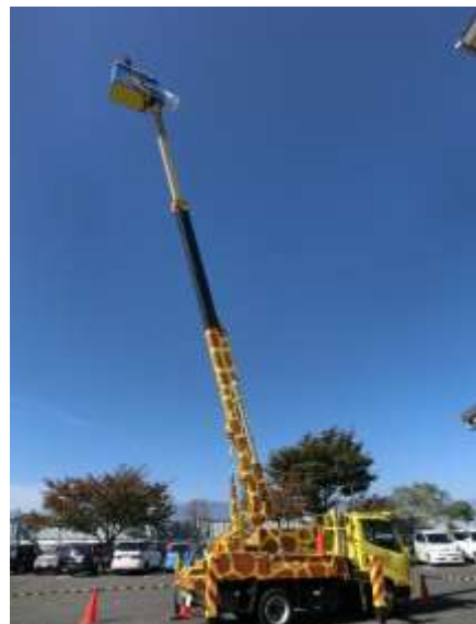
圧倒的な高さで可愛さで大人気でした