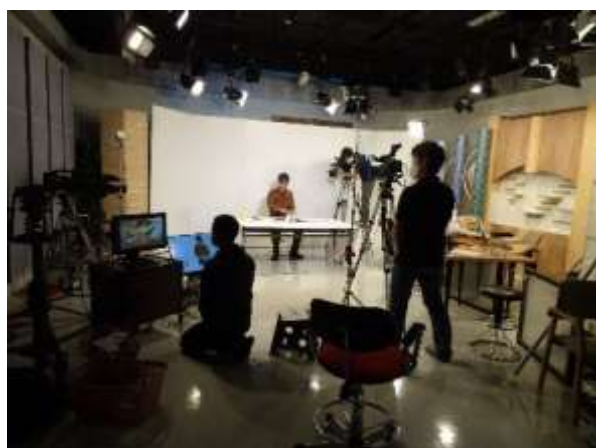
動画撮影のスタジオ風景