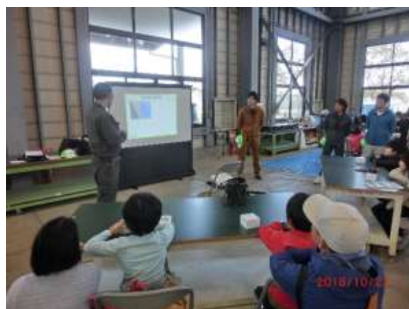
映像で電気工事を知ってもらいました