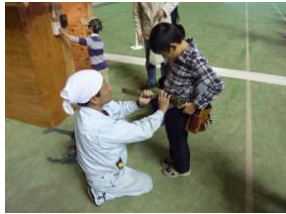
未来の電気工事士誕生！ちょっと大きのかな