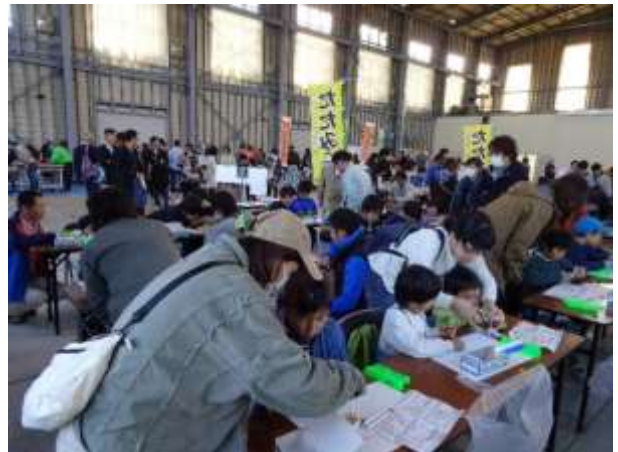
親子で協力して完成を目指します