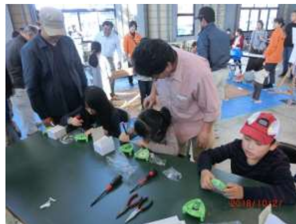
道具も上手に使えたよ！