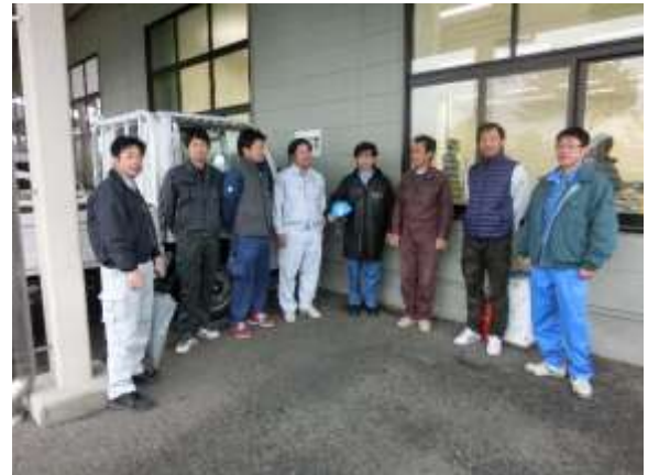
当番支部の松本支部会員皆さん、お疲れ様