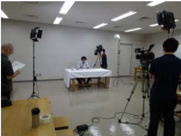
動画撮影のスタジオ風景