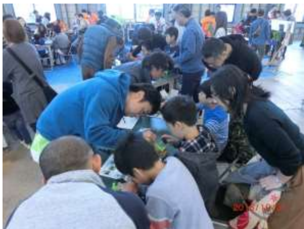
親御さんも真剣に見守ります