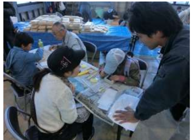
親子で仲良く！会員も優しくサポート