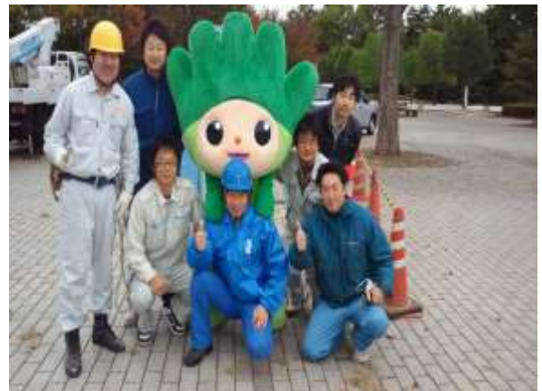
技能五輪マスコット「ぎわまる君」と記念に